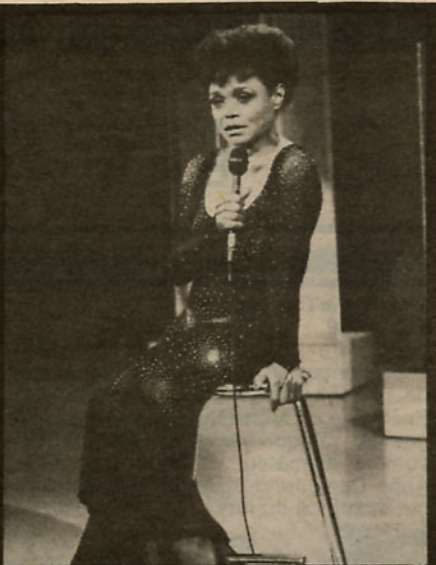
Pour la première de "Showbiz", deux interprètes "hot" et tout à fait opposées: Céline Dion et Eartha Kitt.

grande beauté, en grande santé. Une Nicole Martin sûre d'elle-même qui fera les beaux dimanches de Télé-Métropole après avoir fait un hit avec "En chansons", un variété tout simple dont les cotes d'écoute ont été remarquables (moyenne de 1,5 million de téléspectateurs).