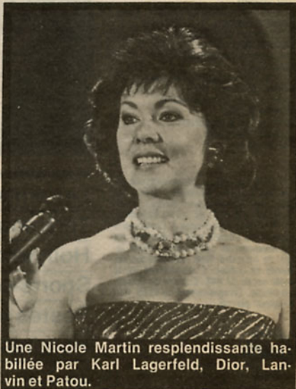
Une Nicole Martin resplendissante habillée par Karl Lagerfeld, Dior, Lanvin et Patou.

Et, bien sûr, il y aura Nicole Martin qui lui dira "Je t'aime autant qu'avant" et ira "Jusqu'à vous". Une Nicole Martin en