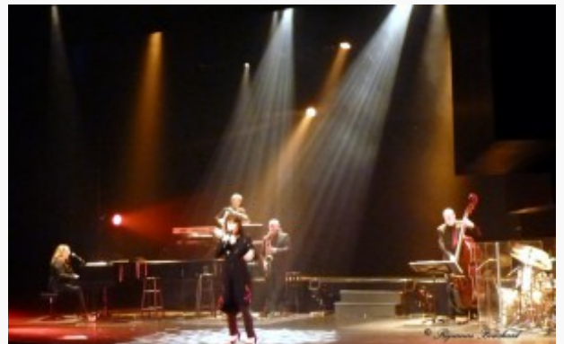
Avec ses musiciens